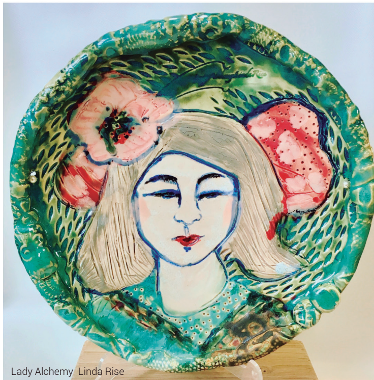
Lady Alchemy Linda Rise